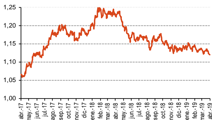
Cotización del Dólar frente al Euro

No existe control de cambios. Existe libertad para realizar operaciones entre residentes y no residentes. Tampoco se aplican restricciones a las entradas y salidas de capitales.