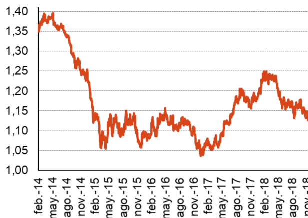
Cotización del Euro frente al Dólar

No existe control de cambios. Existe libertad para realizar transacciones entre residentes y no residentes. Tampoco se aplican restricciones a las entradas y salidas de capitales. No obstante, el Banco Nacional Austriaco solicita la información sobre la transferencia de pagos y capitales para fines estadísticos.